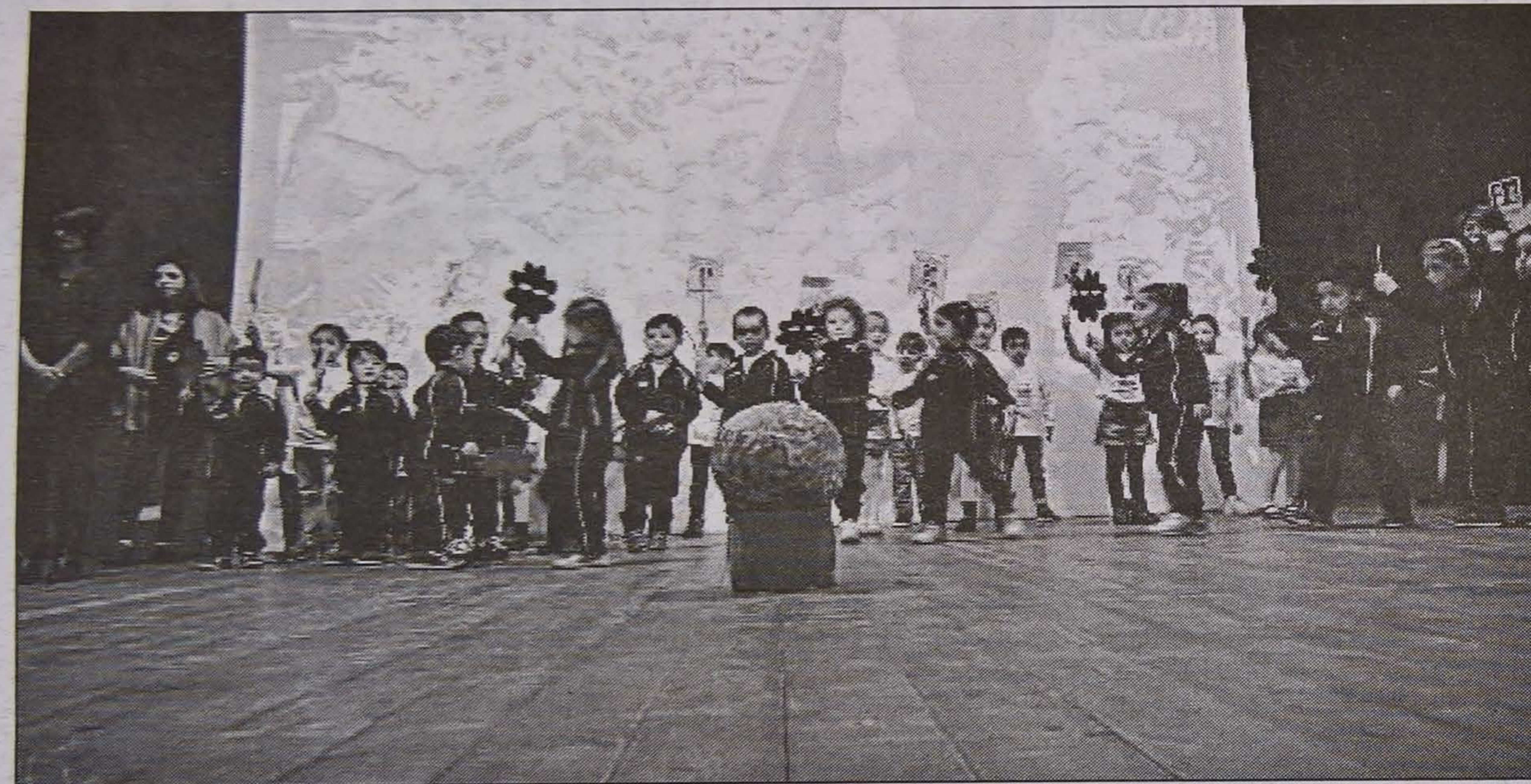
Un momento della manifestazione organizzata a Cirò Marina dalla coop 'I tre melograni'